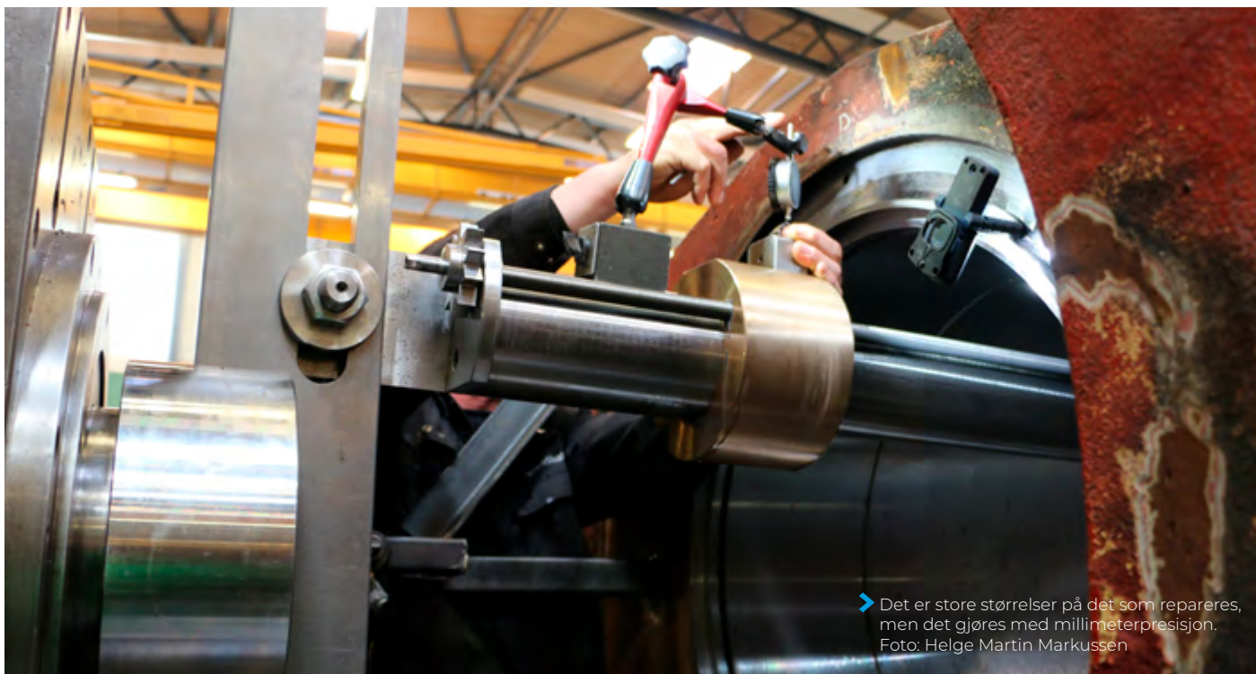
► Det er store størrelser på det som repareres, men det gjøres med millimeterpresisjon.